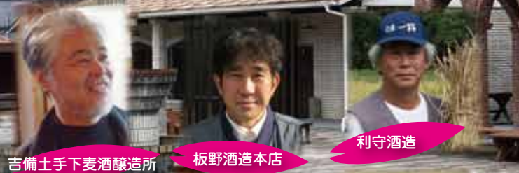
吉備土手小麦酒醸造所