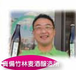
真備竹林麦酒醸造所