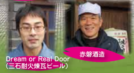
Dream or Real Door (三石耐火煉瓦ビール)